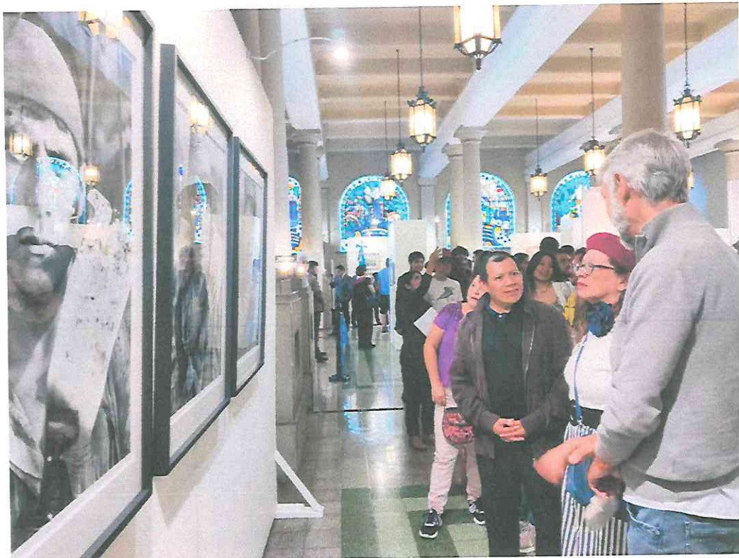
Conversando con compañeros artistas frente a mi obra.