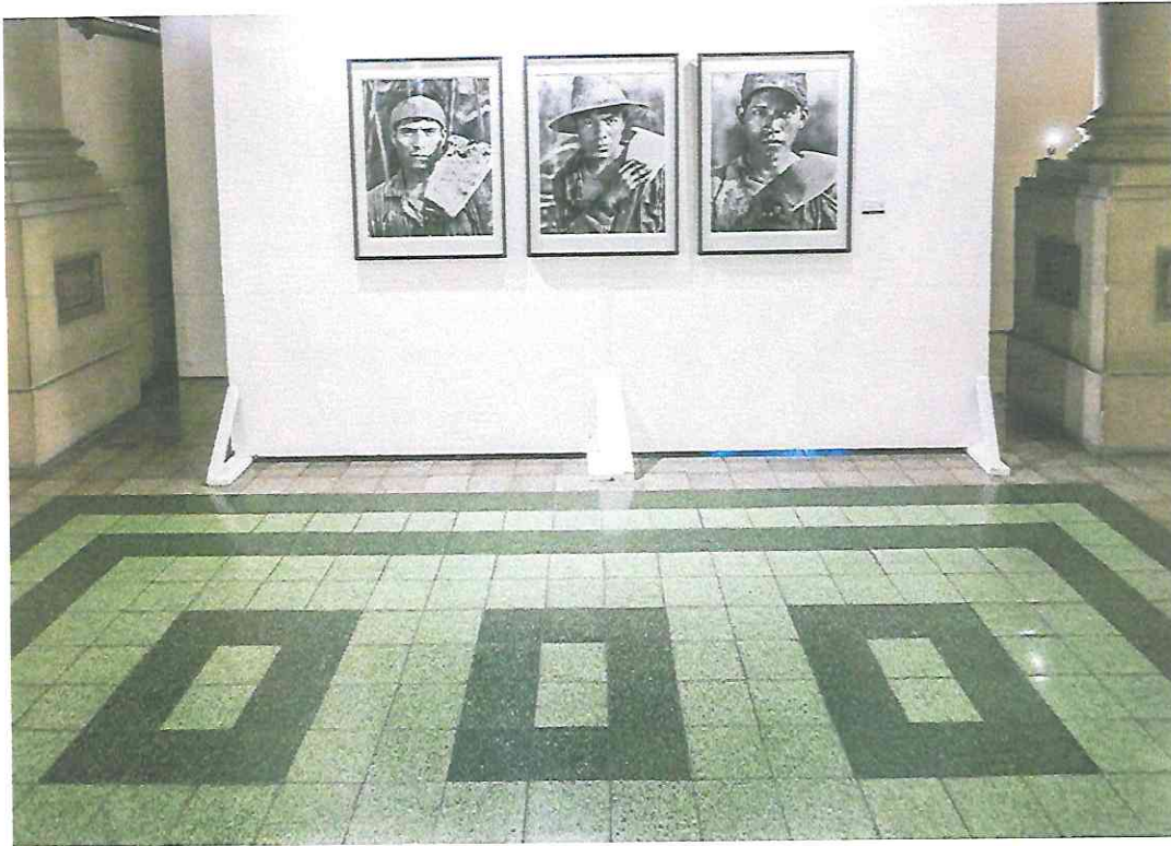
Mi obra "La dulce vida". Tríptico compuesto por tres fotografías realizadas con película 120 mm blanco y negro. Escaneadas e impresas digitalmente con tinta permanente sobre papel libre de ácido.